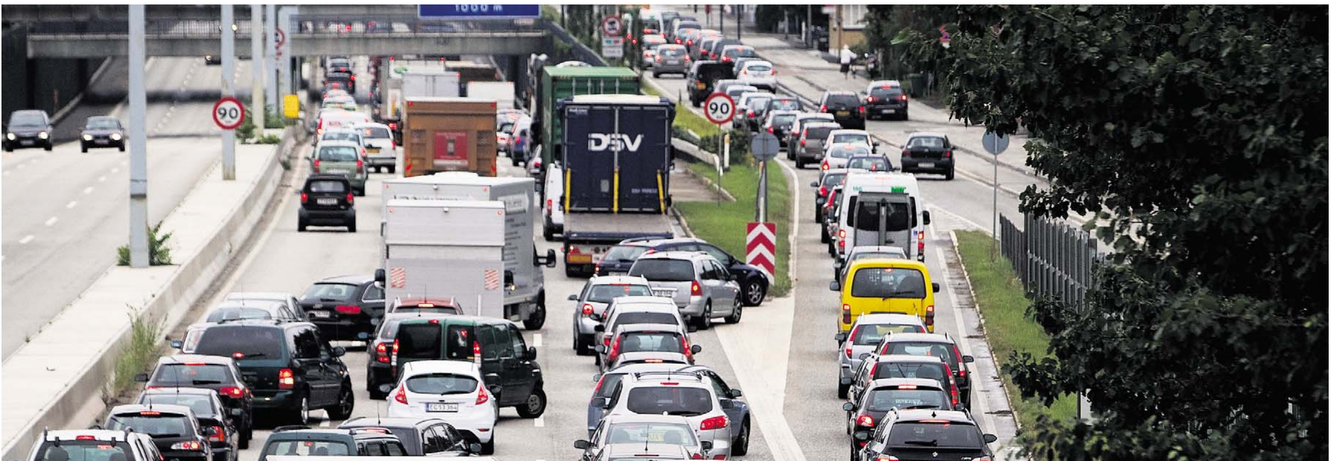
STILSTAND. Det er velkendt, at trængsel på vejene giver forsinkelser og uforudsigelighed, som koster samfundet milliarder. Det er også velkendt, at kørselsafgifter kan dæmme op for trængsel. Men indtil videre holder politikerne stille.